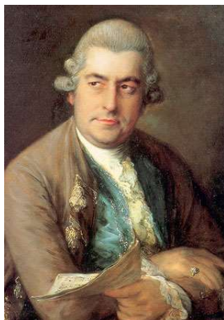
Figure 17 – J. Ch. BACH écrit des trios avec piano dans une syntaxe instrumentale proche de HAYDN et un style mélodico-harmonique proche de SCHOBERT (Vignal, 1997).

Même s'ils sont postérieurs aux œuvres étudiées ici, il convient de parler maintenant des atypiques trios avec clavier de HAYDN. (Rosen, 1971) leur consacre un chapitre entier. On peut résumer (de manière forcément schématique) la syntaxe de ces œuvres comme suit. A l'opposé du principe d'égalité des instruments qu'il avait imposé dans le quatuor à cordes, HAYDN instaura la primauté du pianoforte, dans une écriture virtuose à la main droite 36 . Dans ces conditions, les basses de l'instrument manquaient de force ; HAYDN les doubla donc « colla parte » par la basse d'archet, astreinte à ce rôle. La main droite manquait de legato et de nuances dynamiques ; HAYDN ajouta donc un léger contresujet ou une réponse du violon, bien moins présente et virtuose que la partie de piano -raison supplémentaire pour renforcer les basses. Mais parfois cet éternel humoriste musical qu'était HAYDN divergea de cette pratique, n'hésitant pas par exemple à surenchérir sur la sécheresse du pianoforte « staccato assai » en le doublant par des pizzicati de cordes, une « petite note » dans le médium étant la seule signature de l'instrument. Ainsi commence le trio en Mi majeur Hob. XV.28 de 1797 (un Maurice RAVEL (Marnat, 1995-b) eût été certes ravi de cette écriture !) :