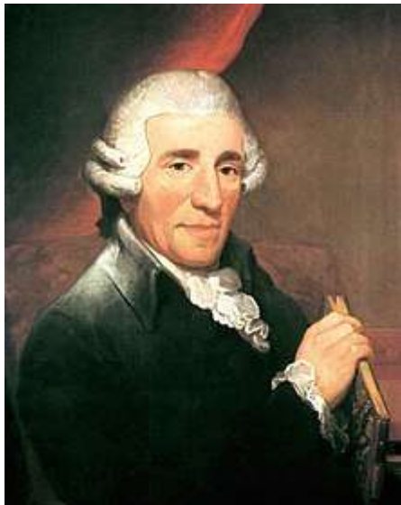
Figure 4 - Joseph HAYDN était très influent à PARIS. Il écrivit en 1785 et 1786 ses six symphonies n° 82 à 87 pour le comte d'Ogny et le « Concert de la Loge olympique ». Il est très instructif de comparer ses trios à ceux de Johann SCHOBERT.