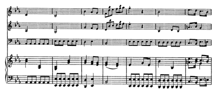
Figure 12 – Extrait du début du finale de de l'op. VII/1 : figure de liaison en triolets aux cordes.

Quoiqu'articulée sur une large cadence harmonique, la fin du mouvement donne un sentiment assez abrupt.