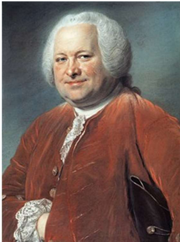
Figure 9 - Le (très riche) fermier général Alexandre Le RICHE de La POUPLINIÈRE (1693-1762) possédait un des meilleurs orchestres de la capitale. Il fut le mécène de RAMEAU, contribua de manière décisive à la naissance de l'école de Mannheim en embauchant à sa tête Johann STAMITZ en 1754. C'est GOSSEC qui lui succéda un an plus tard.