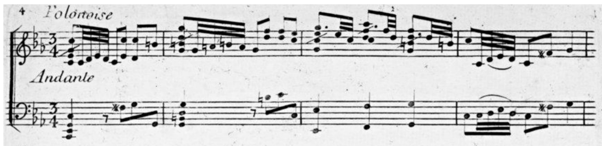
Figure 16 - Début du second mouvement de la sonate op XIV n°1.