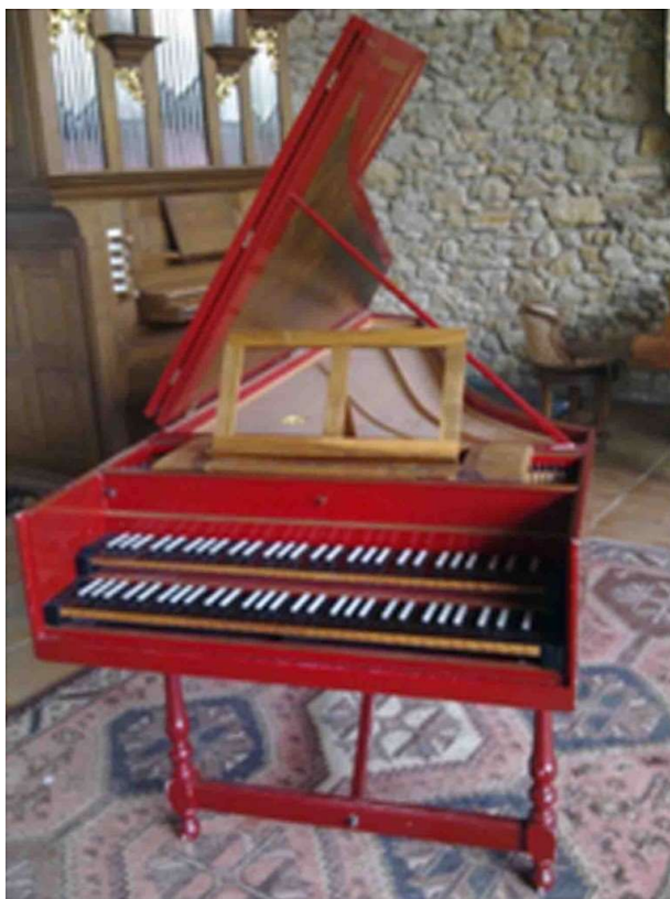
Figure 1 – Le clavecin du Festival du Comminges 1