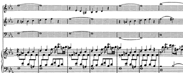
Figure 10 – Début du passage central « au dessin thématique affirmé » dans la première section du premier mouvement de l'op. VII/1. Noter comment une partie en noires des deux dessus de cordes est écrite à l'unisson du clavecin, seul à énoncer le trille en fin de trait ascendant. Noter également la pédale de double voir triple octave de dominante de dominante (V de V), dont les parties extrêmes sont aux cordes, et la/les partie(s) intermédiaire(s) au medium du clavecin.

Conformément à une tradition tant baroque que classique (alors en partie à venir, ce qui est une remarque stylistique importante), les volets externes du menuet se composent d'alternances de micro-sections tantôt très carrées, an accords, et