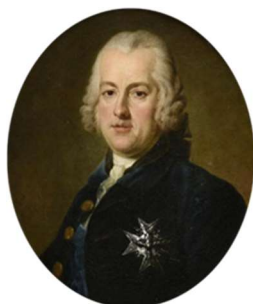
Figure 6 - Louis-François de BOURBON, prince de CONTI (1717 – 1776).

Notre compositeur entra au service de Louis-François de BOURBON (1717 – 1776), comte de la MARCHE, duc de MERCEUR puis prince de CONTI (1727), cousin de Louis XV, en 1760 ou 1761.