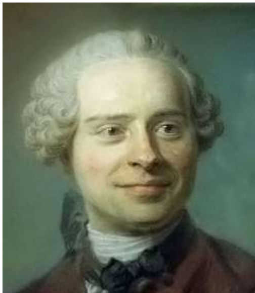
Figure 20 - Jean LE ROND D'ALEMBERT (1717-1783) l'un des fondateurs de l'Encyclopédie, entreprise avec laquelle il finit par prendre quelque distance. Il fut initialement un soutien inconditionnel de RAMEAU avant que ne surviennent quelques divergences.