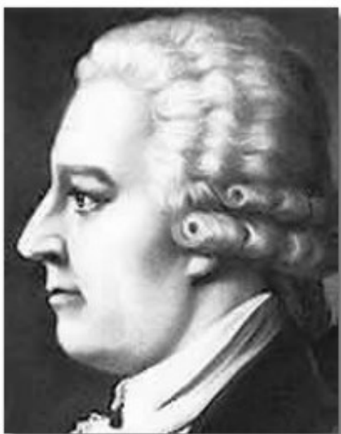
Johann SCHOBERT (1735 ?-1767)