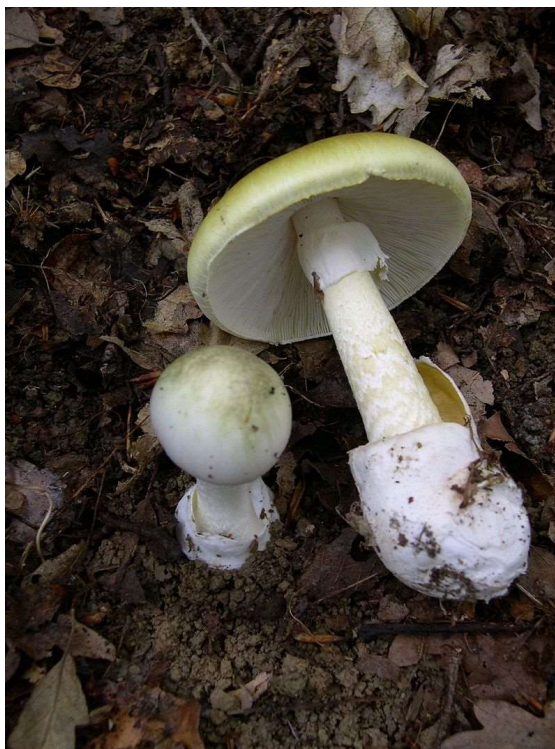
Figure 21 – Selon la maréchaussée, le suspect numéro un d’après la déposition du baron GRIMM .....

Baron Frédéric-Melchior Grimm, lettre de septembre 1767.