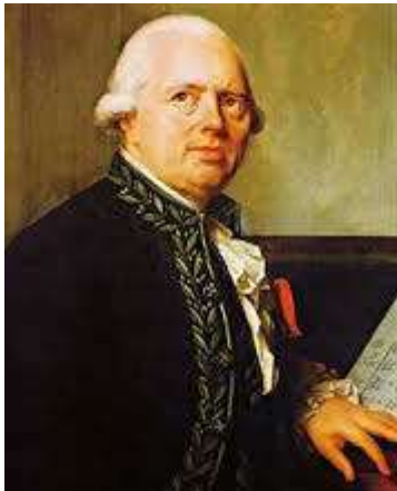
Figure 8- François-Joseph Gossec (1734 – 1829)

Sous les assauts d'un pseudo-italianisme facile, le style « sérieux » emprunta d'autres voies. Si cette querelle 24 laissa des traces sur le futur style de SCHOBERT , ce ne fut certes pas une influence italianisante, mais plutôt « obliquement » l'introduction d'un certain subjectivisme via le style « rococo » dans le cadre d'un maintien du souci des architectures solides et de la tenue de l'écriture.