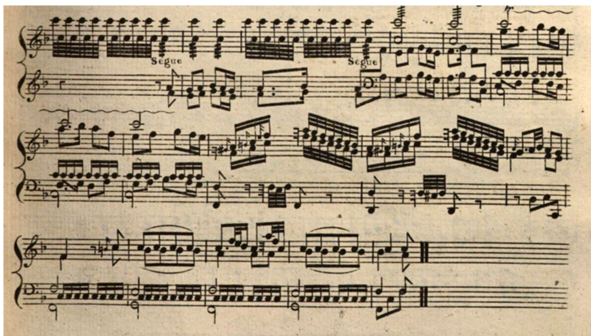
Figure 14 – Fin du second mouvement « andante » de la sonate III op XIV – Partie de clavecin.

Parfois, comme ci-dessous à la fin de l'andante de la sonate III, l'écriture de clavecin atteint une densité et une stratification du matériau qui semblent regarder loin dans le futur : par-delà C.P.E. BACH (Vignal, 1997), HAYDN (Marnat, 1995-a) et MOZART (Massin, 1990), il nous semble entrevoir certaines pages pianistiques du dernier BEETHOVEN (Massin, 1976 ; Rosen, 2007).