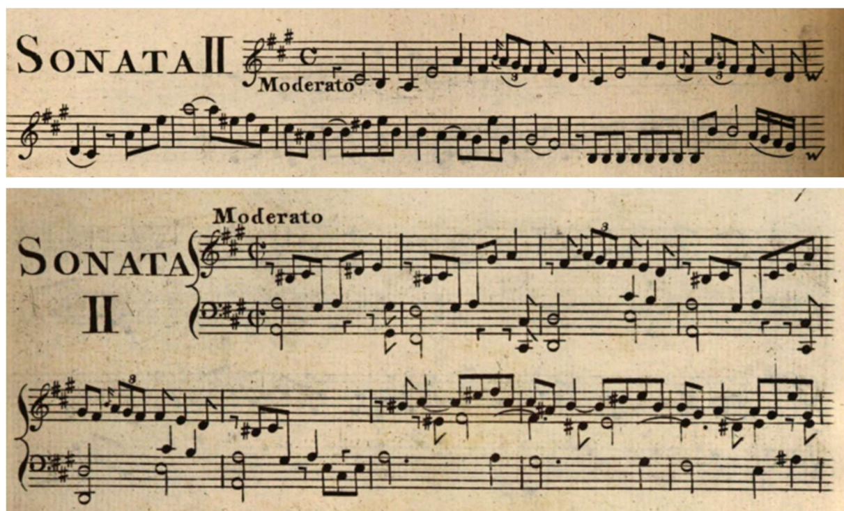
Figure 13 – Début du premier mouvement « moderato » de la sonate II op XIV en parties séparées.

Commençons à feuilleter les sonates pour clavecin et violon « ad libitum ». Bien entendu, partout, l'écriture du clavecin est pertinente pour être jouée en solo. Mais en dépit de ses passages virtuoses, on sent souvent que le substrat harmonique y domine et on aimerait entendre une ligne mélodique qui lui donna raison d'être. C'est le plus souvent la ligne de violon « ad libitum » qui y pourvoit. Ouvrons le tout début de la première de ces sonates (la sonate II, donc). Les basses sont en octaves. La main droite du clavecin propose une partie de contralto enrichie d'appoggiatures chromatiques qui peut effectivement faire office de chant dans les deux premières mesures ; mais le vrai chant, plus simple, est au violon. Les deux voix convergent, à la mesure 3, sur un unison au rythme plus complexe comprenant un triolet de croches avec une petite appoggiature caractéristique (il va de soi que, si l'on se prive du violon, cet effet d'unisson est détruit). Le dispositif se reproduit avec de subtiles variantes, amorçant l'ascension harmonique vers la dominante.