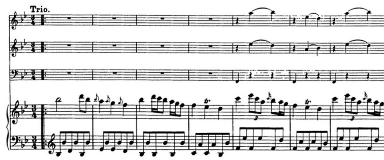
Figure 11 – La délicate écriture de clavecin solo du trio du menuet de l'op. VII/1, contrastant avec l'écriture des volets externes.

de sections plus mélodiques quoique de rythmique affirmée (comme il se doit pour une pièce d'origine chorégraphique). De manière générale, les sections « carrées » sont ici des unissons entre clavecin et cordes (partiellement écrites en double cordes) alors que, dans les autres sections, l'élément mélodique est plutôt confié aux cordes, le clavecin se chargeant de l'expression du squelette rythmique. Ceci tend à prouver une fois de plus que l'exécution au clavecin solo reste possible (« correcte ») mais est appauvrissante, au moins dans les sections mélodiques. On note généralement que, chaque fois que la composition instrumentale le permettait, tant classiques que baroques tendaient à souligner les sections rythmiques, par un « tutti » ou à défaut une écriture plus compacte. Par contraste, ici, le trio est quasiment confié au clavecin qui joue un réel rôle de soliste, les cordes se contentant de quelques accords qui, sans être superflus, ne s'avèrent pas complètement indispensables. SCHOBERT apporte donc une solution ingénieuse au traditionnel contraste entre volets extérieurs du menuet et trio, quasiment occultée par la prise en compte du « ad libitum ».